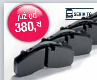
Komplet klocków hamulcowych