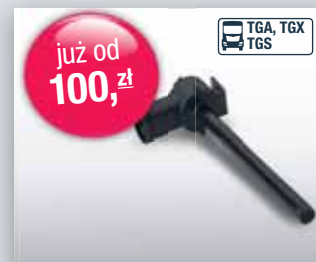
Sonda płynu chłodzącego