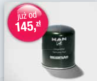
Wkład osuszacza powietrza