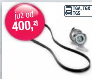
Napinacz z paskiem

Oryginalne Części Zamienne MAN®. Oferta promocyjna: