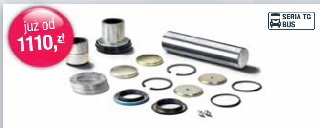
Zestaw naprawczy zwrotnicy